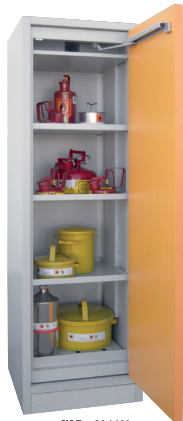
SiS Typ 30 / 600, Artikel-Nr. B80-2603-A, Tür RAL 1007 - narzissengelb, inkl. 3 Einlegeböden, Bodenwanne und Lochblechabdeckung