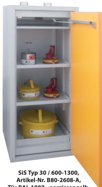
SiS Typ 30 / 600-1300, Artikel-Nr. B80-2608-A, Tür RAL 1007 - narzissengelb, inkl. 2 Einlegeböden, Bodenwanne und Lochblechabdeckung