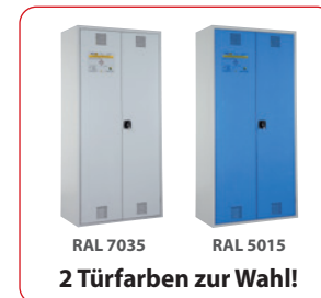
RAL 7035 RAL 5015