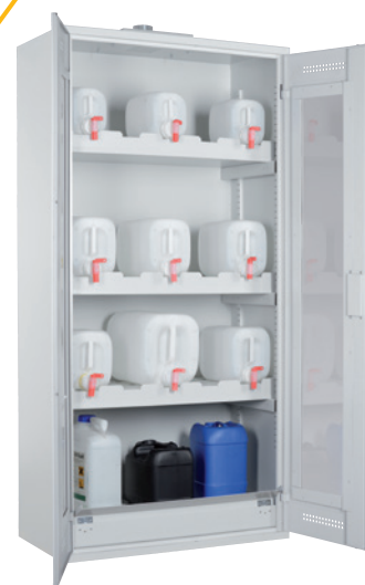
CHS-KAN 950 GL, Türen RAL 7035 Artikel-Nr. B80-6234-A