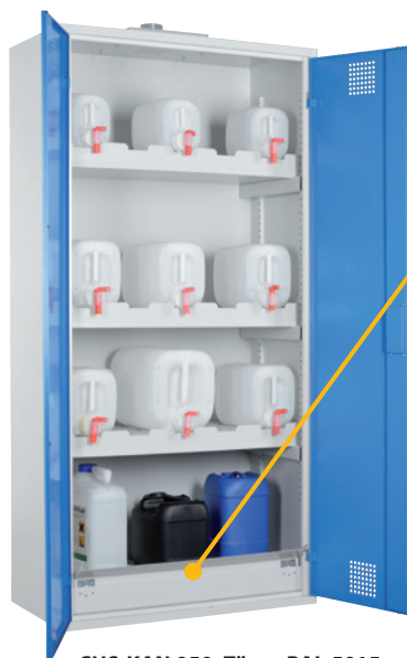
CHS-KAN 950, Türen RAL 5015 Artikel-Nr. B80-6458-A