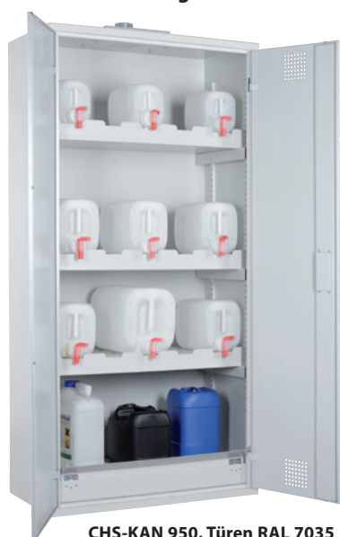
CHS-KAN 950, Türen RAL 7035 Artikel-Nr. B80-6233-A