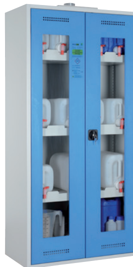
CHS-KAN 950 GL, Türen RAL 5015 Artikel-Nr. B80-6463-A