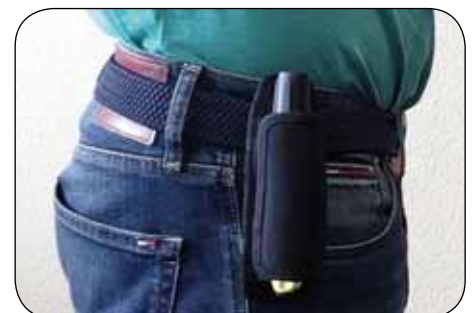
Holster um 360° drehbar, Artikel-Nr. B69-7271-A