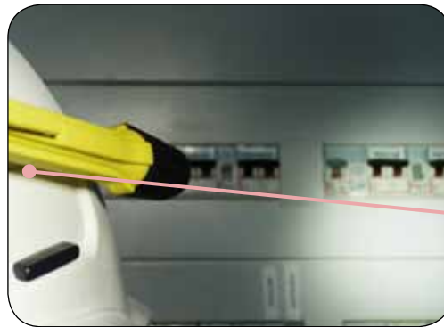
Universal Helmadapter (optional) Artikel-Nr. B69-7454-A