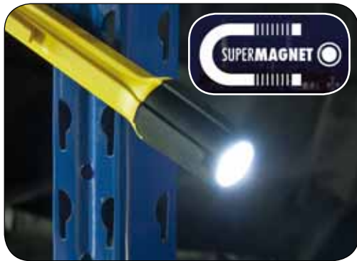
Befestigung an metallischen Oberflächen durch „SUPER-MAGNET“