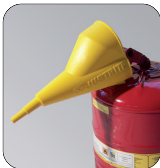
Polyäthylen-Trichter, Artikel-Nr. L15-2022-D