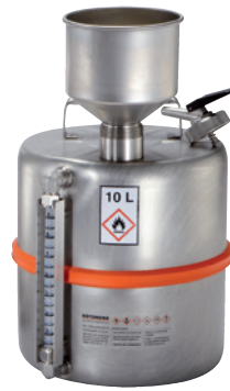
Mit optionalem Trichter