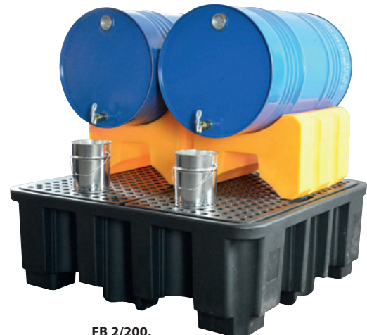
FB 2/200, Artikel-Nr. P70-7114-A