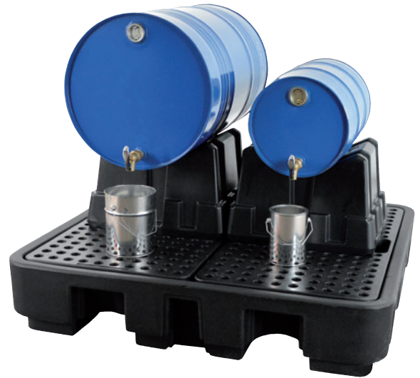
FB 2-Kombi, Artikel-Nr. P70-2033-A, z.B. 1x 200-Liter-Fass und 1x 60-Liter-Fass