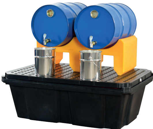
FB 2/60, Artikel-Nr. P70-7113-A