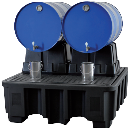
FB 2-Kombi, Artikel-Nr. P70-2033-A, z.B. 2x 200-Liter-Fass