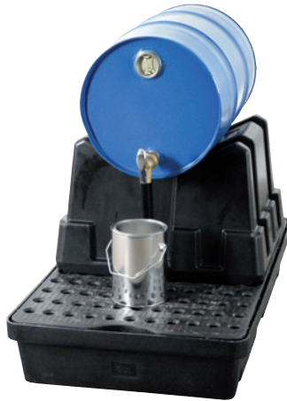
FB 1-Kombi, mit 60-Liter-Fass, Artikel-Nr. P70-2031-A

Bei Nichtnutzung ist der Fassbock platzsparend stapelbar!