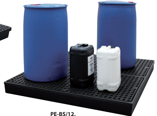
PE-BS/12, Artikel-Nr. P70-2071-A

Kombinationsbeispiel aus PE-BS/11, Artikel-Nr. P70-2070-A und PE-BS/12, Artikel-Nr. P70-2071-A mit optionaler PE-Auffahrrampe für Fasskarre