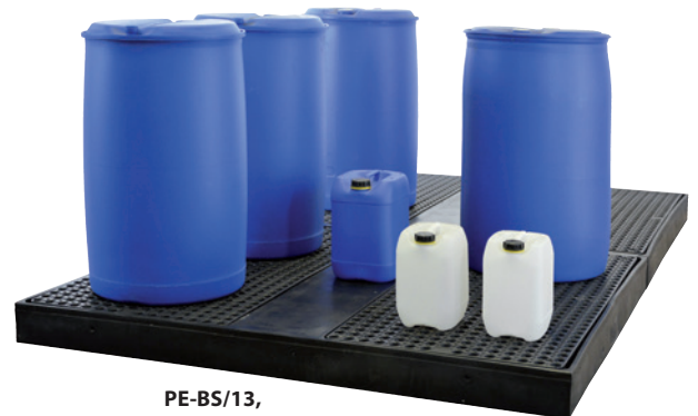
PE-BS/13, Artikel-Nr. P70-2076-A