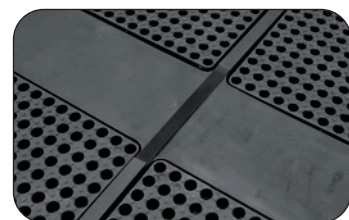
Wannensteg VB 050, Artikel-Nr. P70-2077-A