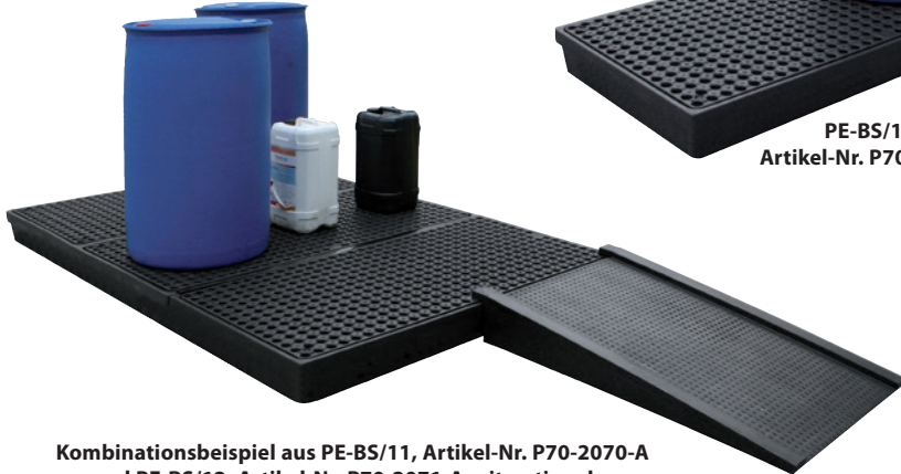
PE-BS/11, Artikel-Nr. P70-2070-A